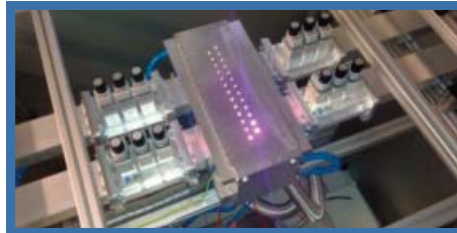
Abb. 1: Anlage mit Betrieb von zwei Mikrowelleneinspeisungen

Am Fraunhofer-Institut für Werkstoff- und Strahltechnik (IWS) wurde im Rahmen eines öffentlich geförderten Projekts eine Niederdruck-Mikrowellen-Plasmaanlage zur kontinuierlichen Karbonisierung von voroxidierten PAN-Fasern entwickelt. Kernstück der Anlage ist eine linear ausgedehnte Kavität mit einer Länge von momentan 400 mm. Sie beherbergt im Inneren ein Quarzglasrohr mit einem Durchmesser von 70 mm, durch das die Fasern hindurchgeführt werden (Abb. 1).